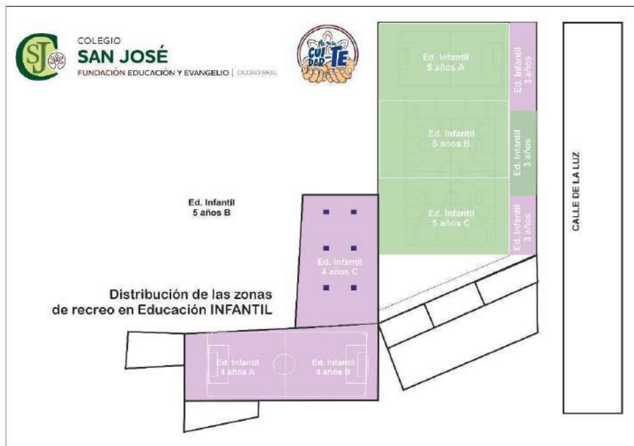
Educación Primaria Distribución de espacios